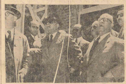
نوری السید تخت وزیر عراق چند لحظه قبل از بردن از فرودگاه مهر آباد

صبح امروز رئیس شهربانی کل کشور ببلند رفت