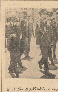
مهندس قائم مقام معاون وزارت امور خارجه امریکانگام تهرک خاک ایران

وضع شهرداری خرمشهر موجودی و ذخیره شهرداری خرمشهر در هجرتی هجرتی و تطاول قرار گرفته است