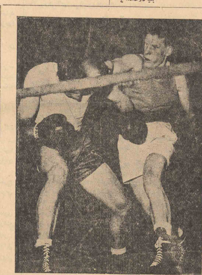
یک صحنه از همبج ترین مسابقه بوکس بین باوادیای آلمان و تیم بوکس تهران