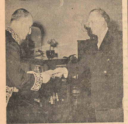
هفته گذشته آقای عبدالعزیز میکده مدیر کل ایران در بلگره استوارنامه خود را تسلیم مارشال تیو رئیس جمهوری یوگوسلاوی کرد. این عکس مراسم مذکور را نشان میدهد

در شرفیابی نجم الملک به پیشگاه ملوکانه شاهنشاه برای عمران و آبادی خوزستان و بلا بردن سطح زندگی مردم آن استان او امر مؤکدی صادر فرمودند استنادار خوزستان دیش بخبرنگار ما گفت: احتمال دارد قبل از زیمت شاهنشاه بقریه که به احوال مراجعت نمایم برای اجرای برنامه های عمرانی و ساختمانی و تامین اعتبار آنها مذاکراتی با مسئولین چند وزارتخانه صورت گرفته است در تاسی که دیش خبرنگار ما