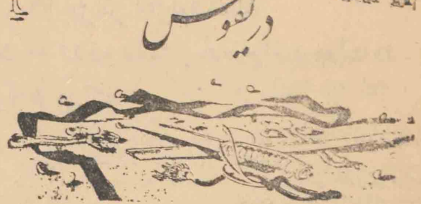
۳۹- در آن هنگام روزنامه نکامی (روزنامه) با اشاره بواقعه درفوس کلماتی درجین نوشته بود:

جوانی بود که فامیلیش نصیب داشته جرای او زن بگیرند مره جوان زناه احتیاط از پدر و مادر خود درخواست کرده که نه تنها عکس او را بنامزد احتیالی او نشان دهند بلکه درباره جزئیات کار درفوس نیز با او مذاکره مفصلی بسازد. آورنده که آیا وارد بان موضوع هست یا نه؟