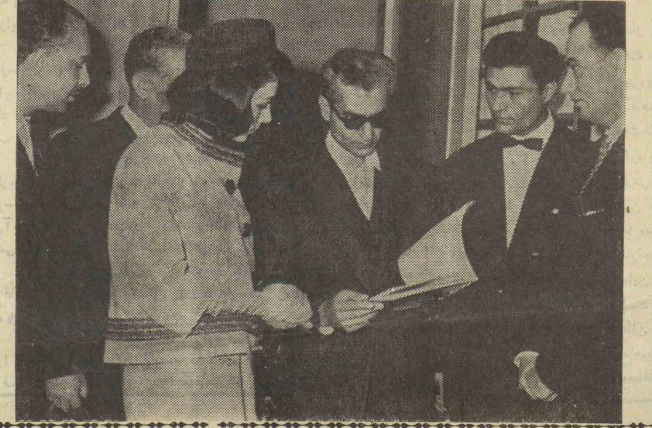
در این بازدید شاہنشہ و علیا حضرت ملکہ از کلیہ وسائل آموزشی تصویری و غیر تصویری و همچنین از فیلم پرورش نوین کودکان درودند

کریمستیان ہر تر ہمراہ یک ہیئت ۱۲ ہفتی برای شہر گت در کنفرانس شورای وزیران تہران می آید مرکزی بعنوان ناظر شہر کت خواهند جست . شورای مذکور از روز ہشتم تا دہم اردی بہشت ماہ در تہران تشکیل خواہند و ہر تر و ہمران از روز سہ شنبہ این ہفتہ از دانشگاہ تہرہسپار تہران میروند .