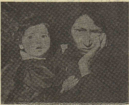
ہمسر بیوہ و کودک یتیم پاسبان از اینکہ میدیدند عدالت اجرا شدہ است خوشحال بودند

راستی ماجرای کندن خیابانہای تہران برای مردم بلائی شدہ است بر اثر کندن این خیابانہا روزی نیست کہ تصادفی رتندہد . سراسر خیابانہا را میکنند و خاکش را دور و دور آن جمع میکنند و ہیچ بنگر بہداشت مردم تہستند تمام رانندگان از این وضع بسیار ناراحتند یکی از رانندگان تعریف میکرد وسط خیابان گردال بزرگ و صعبی میکنند و باچہا را لامب فرم کہ اصلانوز ندارند ازما انتشار کردہ کہ متوجہ خطی بشویم در