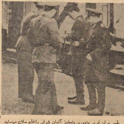
پلیس برلن غربی مامورین متجاوز آلمان شرقی را خلع سلاح مینماید

دولت آلمان غربی مصمم است روش غیر انسانی دولت آلمان شرقی را نسبت به مردم این ناحیه بکلیه بشوهد