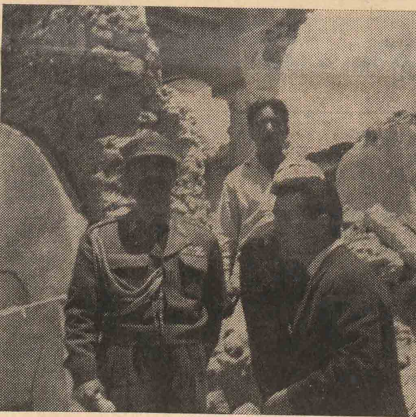
ویرانه های لار برهیننده را متاثر می سازد در عکس فوق تیمسار گوردستانی فرماندار نظامی شیراز با بافان رئیس هیئت اعزامی کمک امریکائی برای کلیه کشور های «کار» در حال بازدید خرابیهای زلزله لار دیده میشوند

ساعت هشت و نیم بعد از ظهر دیروز آقای دکتر نفیسی رئیس هیئت مدیره جمعیت شیروخورشید سرخ ایران بخیر نیکارما اظهار داشتند صبح روز پنجشنبه هشتم اردیبهشت ماه (فردا) والا حضرت شاهدخت شمس پهلوی ریاست عالییه جمعیت شیروخورشید سرخ ایران برای بازدید از مناطقی زلزله ورهیدگی بوضع زلزله زدگان با هواپیما به لار خواهند رفت.