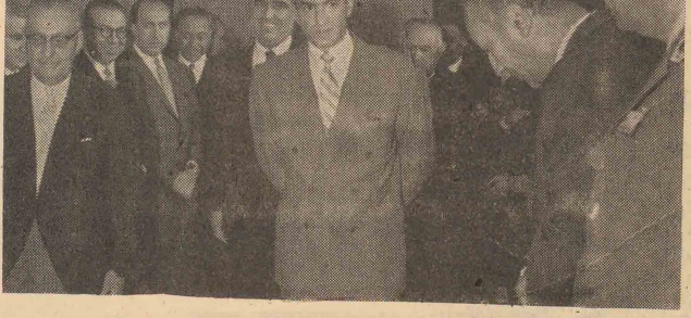
شاهنشاه در محل بنای جدید اتومبیل گلوب شاهنشاهی

به نیر و های نظامی استانبول دستور داده شده است هر کس که در شهر دست بنظواهرات بزند هدف گلوله قرار دهند