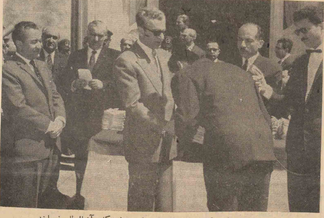
شاهنشاه اسناد مالکیت کشاورزان مازندران را به نمایندگان آنها اعطاء فرمودند

از کشاورزان مازندران را طی مراسمی به نمایندگان آنها اعطاء فرمودند