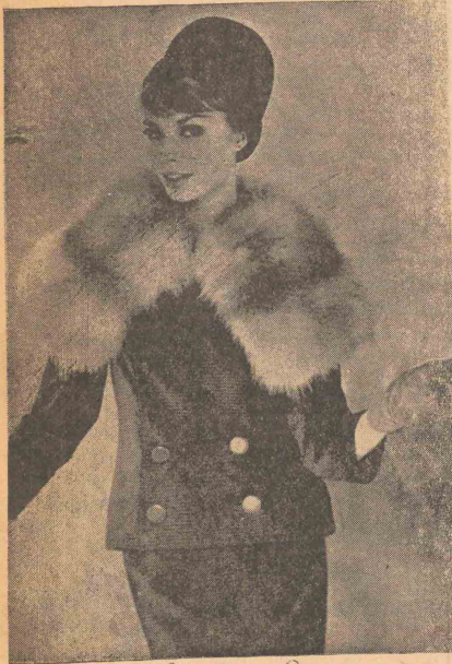
کت و دامن زیبایی است که بقیه آن از پوست ساخته شده پارچه این لباس مشکی را مزاج است اصولاً بقیه های پوستی برای زمستان امسال رواج فراوانی پیدا کرده است.