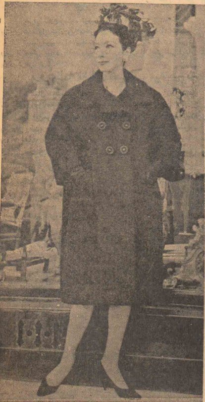
مانتوی زیبایی است از پارچه مشکی که برای او از خرمستان و اوایل بهار مناسب است. چنانکه ملاحظه میشود طرز دوخت که مایل آن بسیار جالب است

خوانندگان و علاقمندانی که جدول طرح و ارسال دارند بنام ایشان چاپ خواهد شد