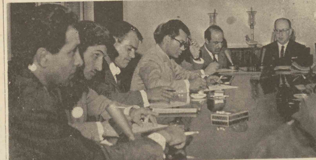
خبر نگاران مطبوعات در جلسه مصاحبه دیروز سفارت آرژانتین

بقیه از صفحه ۱ و شبها نو فرج بکتور آرژانتین اطلاعاتی در اختیار نمایندگان مطبوعات قرار دادند. سفر کبیر آرژانتین نظمی ایراد کرده که متن آن بنیان فرانس در اختیار خبرنگاران گذارده شد ترجمه این متن بدین شرح است: پس از مسافرتی که بخاطر یازدهم عالی علیحضرت همايون شاهنشاه نصیحا نوایران از آرژانتین بکتور کردم، خواست با جراید ایران تماس حاصل کنم تا آنها را درباره آن مطلبی که علیحضرت بن دولت و ملت آرژانتین بجای گذاشتند، و همچنین استقبال گرمی که مردم آرژانتین بعمل آوردند، به مطلع سازم.