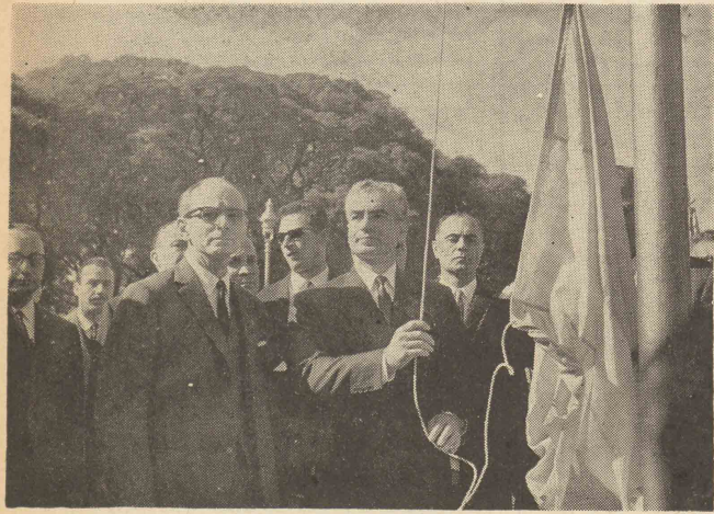
شاهنشاه با افتخار پیرامون «میدان ایران» را در بیروتوس آریس افتتاح فرمودند این عکس دنیوز بوسیله مقامات سفارت آرتانین در اختیار مافرا گرفت

شاهنشاه پادشاهی ممتاز، متجدد، پیشرفت طلب و مطلع بحقایق اموز دنیا و مملکتشان هستند