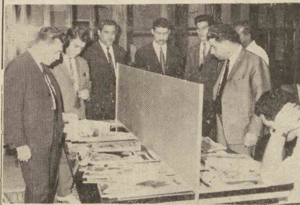
مهمانان شرکت ملی نفت در دفتر انتخانها باشگاه

بنابعدت شرکت ملی نفت ایران ۵ نفر از آقایان روسای اطلاعات و مطبوعات استان گیلان با آبدان وارد شدند و مورد استقبال قرار گرفتند. آقایان مزبور از تاسیسات صنعت نفت در آبادان دیدن کردند و در جلسه بحث و مذاکره با مدیران صنعت نفت در مرکز روابط عمومی شرکت جستند. پس از بازدید تاسیسات نفتی اهواز و جزیره خارک گروه مزبور از آبادان راجعتن تهران ترک گشت.