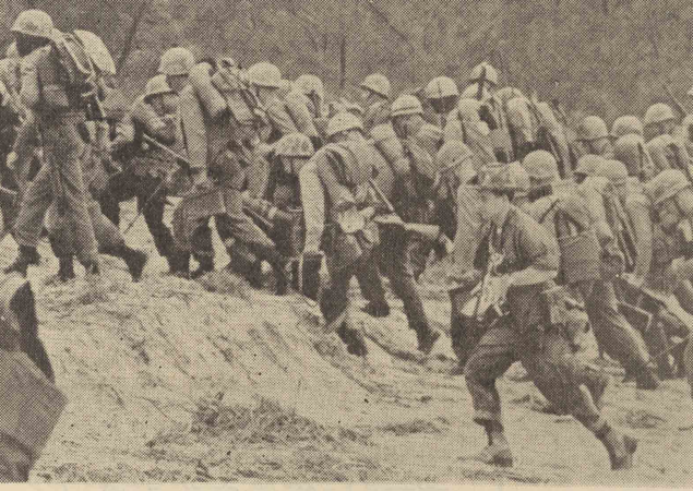
واحد های نظامی امریکا و وینام جنوبی دوش بادوش هم علیه ویت کونگ ها می جنگند

۱- کسی که بمقتضای زمان کار کند ۲- تابیدن - احاد ۳- خوب - از مکتبات ۴- محل برگزاری مسابقه بوکس - ازال ۵- گرسنه خبری ندارد ۶- دهان جمع کن - جاده راه آهن ۷- بهره و کار کرد - پایبندی در اروپا ۸- نشانه - ثروت ۹- خسته و آزرده - از قهرمانان شایسته ۱۰- نوعی راه رفتن اسب - غفلت و فراموشی ۱۰ - فرش - حرف اضافه