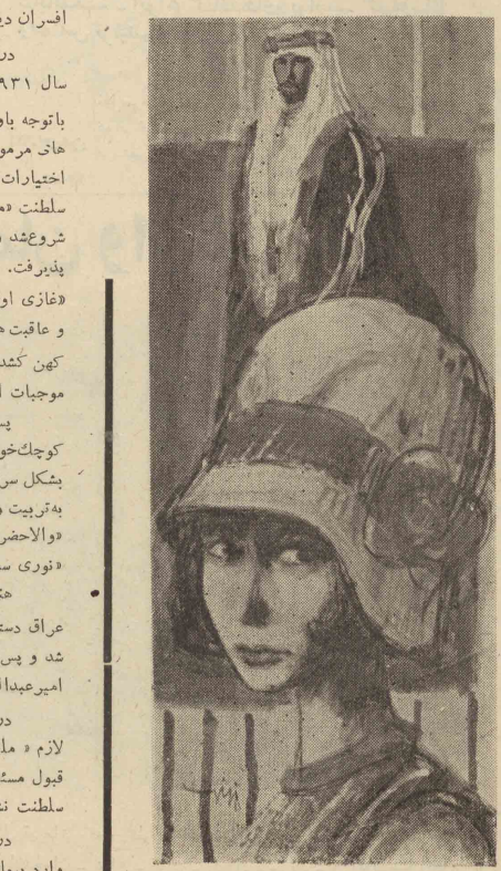
در عراق ایجاد کنند، ادامه داشت و با این که داور دست سرهنگ «کامیل شیب» دستگیر شده بودند،

هنگام انقلاب زشید عالی گیلانی به سال ۱۹۴۱، عراق دستخوش هرج و مرج و ناراحتی های بسیاری شد و پس از فرار رشید عالی گیلانی به سال ۱۹۵۳ امیر عبدالله به نیابت سلطنت خود ادامه می داد.