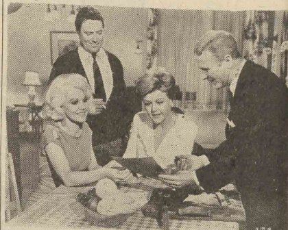
... و قراردادی امضاء میشود

بمناسبت آغاز بیست و پنجمین سال سلطنت شاهنشاهی بطوریکه خیرنگار ورزشی و جراحانی خواهد بود. گزارش خیرنگار مازاها کیست که در این مدت هفت روزه بنامه های جالب ورزشی و هنری بسر گزار خواهد شد و ضمناً از مدعوین پذیرائی گری بعمل خواهد آمد.