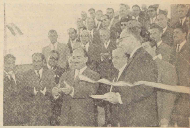
وزیر آب و برق با قطع نوار سه رنگ توربین های گاز نیروگاه شتران افتتاح کرد

ما مطمئن داریم با اقدامات موثری که از طرف کلیه مسئولین وزارت آب و برق بعمل می آید موجبات رضایت خاطر شاهنشاه عظیم الشان فراهم میگردد پس از اظهارات آقای نخست وزیر بر نامه بازديد از دستگاهها صورت گرفت و در پایان مراسم از مدعوین پذیرائی بعمل آمد.