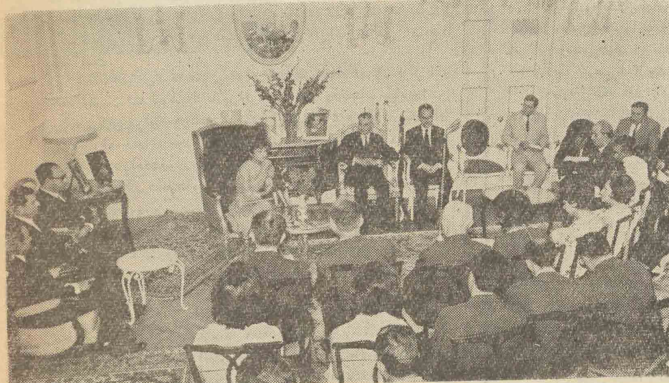
والاحضرت شاهدخت اشرف پهلولی در جلسه مصاحبه مطبوعاتی دیروز