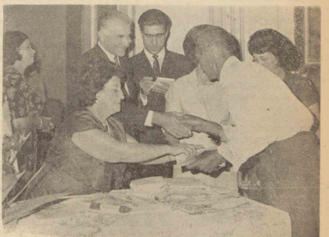
گواهینامه های تحصیلی بوسیله شهردار تهران و بانو تربیت نماینده مجلس شورای ملی توزیع شد

دیشب آقای مهندس سر لک شهردار تهران هنگام توزیع گواهینامه های دومین دوره کلاسی مبارزه با بیسوادی در ناحیه دو شهرداری اظهار داشت، خدمت در شهرداری يك خدمت خاصی است که قابل قیاس با