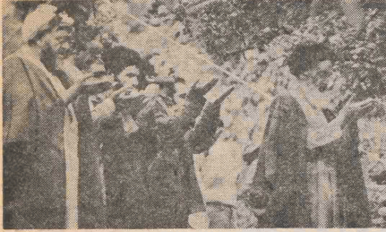
حضرت آیت‌الله العظمی خمینی

امام خمینی: مردم در مقابل دولت باید ایستادگی کنند اگر رژیم، بهشت درست کند ملت نمی‌خواهد