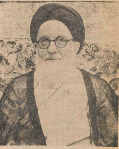
حضرت آیت الله العظمی شریعتمداری

آیت الله شریعتمداری در پیامی به ملت ایران، بارزاد دلورانه ملت ایران را که پس از نیم قرن سلطه خود کامگی و استبداد از میان برد ستوده و بر حمت والای مردمی که درس حقیقتی و آزاد خواهی را با سر بلند و بی زور و بی پشایی تاریخ ثبت کرده هکنر گزارده است. آیت الله به از تشریع و ویژگی های نهضت انقلابی اسلامی ایران اضافه کرده در این روزهای حساس که ایران خراب به سازندگی و بهای جدید نیازمند است ضروری می آید که نکات لازمی را مجدداً به اطلاع عموم برسانیم. ۱ - کرار شده می شود که افراد غیر مسئول در تهران و شهرستان ها مسلحانه به منازل مردم یورش می برند و از ادبی دا به نام چنانیکاران رژیم سابق دستگیر می کنند و موجب وحشت و اضطراب خانوادها می گردند باین دسته از مردم اعلام می دانیم که اولاً حساب کسانی از رژیم سابق که مرتکب قتل و شکنجه و غارت بیت المال شده اند با صاحب اکثریت کارمندان و کارکنان دولت های گذشته جدا است و ثانیاً تعقیب خطا کاران و بقیه در صفحه ۴