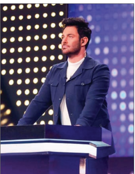
گیر ماه پانتولیگ فارسی نیست