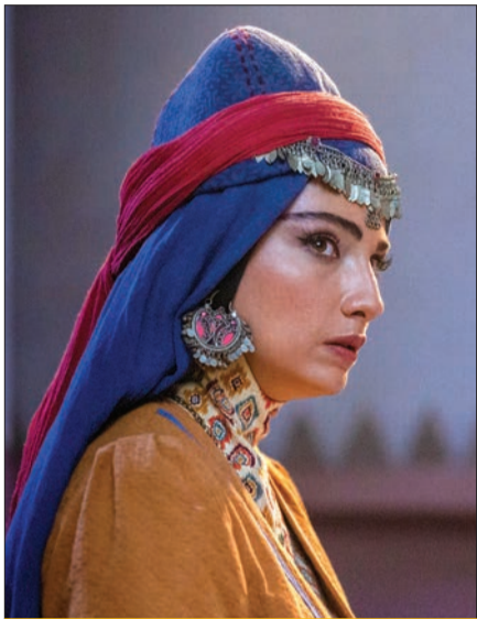
می‌آید ماه مستوران تمام نشد

گروه تلویزیون | در بهمن ماه نیز تلویزیون و شبکه نمایش خانگی سرشار از اتفاقات گوناگون بود. حتی برپایی رویدادی چون جشنواره فیلم فجر، روی این دو حوزه سایه نینداخت و هر بار شاهد خبر و اتفاقی تازه بودیم. سه‌م برنامه‌های فوتبالی به دلیل برگزاری مسابقات جام ملت‌های آسیا زیاد بود؛ از درخشش برنامه‌های اینترنتی تا گاف‌ها و ضعف‌های برنامه‌های تلویزیونی. موردی چون جواد خیابانی هم نقش آفرین اصلی این صحنه بود؛ چه در دوتل با خداداد عزیز و دیگر مهمانان و چه در تک‌گویی‌های انتقادی نسبت به مسئولان ورزش کشور پس از حذف تیم ملی. در این ماه همچنین «پایتخت» بار دیگر اجازه بازپخش پیدا کرد. از سه سال پیش که شبکه آی‌فیلم در دی‌ماه ۱۳۹۹ پنج فصل اول آن را پخش کرد، دیگر خبری از آن نبود تا اینکه بالاخره طلسم آن شکسته شد. این اتفاق پس از مصالحه سازندگان «پایتخت» با تلویزیون و تصمیم برای تولید فصل جدید آن رخ داد. در این ماه همچنین سید ابراهیم رئیسی، رئیس‌جمهور در بخشنامه‌ای به دبیرخانه شورای عالی انقلاب فرهنگی، وزارت فرهنگ و ارشاد اسلامی، سازمان صداوسیما و شورای عالی فضای مجازی ماده واحده مصوبه ۱۴ آذر ۱۴۰۲ شورای عالی انقلاب فرهنگی در خصوص انتخاب اعضای این شورا در کمیته تدوین سیاست‌ها و ضوابط حاکم بر صوت و تصویر فراگیر و شبکه نمایش خانگی را ابلاغ کرد. بر روی رسانه‌ها تیزر زدند: «پایان کار ساترا؟» چند حاشیه دیگر هم هست؛ مثل تعبیر عجیب کارشناس برنامه «شبهه» درباره معین که مدتی پیش خبر رسمی دعوت از او برای بازگشت به ایران منتشر شد.