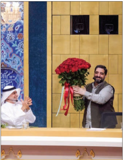
اختلاف نظر ماه چالش شادی مذهبی

سرتیاج ماجرا | کمی زمان می‌برد تا موسیقی جدید جا بیفتد، اثری بسا تأکید بر ایجاد هویت ایرانی در آگهی‌های بازرگانی توسط شهرام منظمی ساخته شده است. شهرام منظمی آهنگساز و نوازنده، فرزند استاد درویش رضا منظمی نوازنده کمانچه و ویولن است. او در یک ویدئو توضیح داده که اولین اولویتش برای ساخت موسیقی جدید آگهی‌های بازرگانی صداوسیما، کوتاه بودن، روان بودن، جذاب بودن و ساده بودن ملودی بوده است. منظمی گفته که سه قطعه موسیقیایی ساخته که اولی در گوشه بیداد همایون، دومی گوشه شور شهنار و سومی آواز اصفهان بوده و همین آخری مورد قبول مسئولان قرار گرفته.