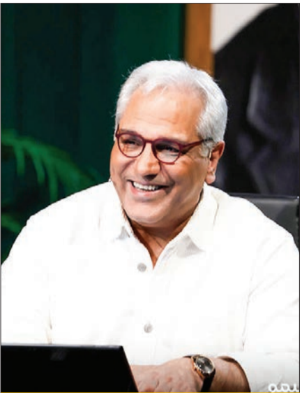
طنز ماه مدبری می‌درخشد

سرتیاج ماجرا | اغلب رسانه‌ها هم موضعی منفی علیه احمدی گرفتند. مثلاً «ورزش‌مدیا» اشاره کرد: احمدی بعد از گل زودهنگام قطر گفت: الان تماشگرانی که در حال ورود به ورزشگاه بودند، بشما نشان شده‌اند. هیچ ساده‌لوحی که در عمرش فقط دو بازی فوتبال دیده باشد، فکر نمی‌کند مسابقه با گل دقیقه چهار تمام می‌شود. اما خوب داستان احمدی در این تورنمنت چیز دیگری بود!