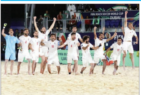
تیم فوتبال ساحلی ایران با پیروزی مقابل تاهیتی، به عنوان تیم اول گروه به مرحله بعد صعود کرد و باید در دور یک چهارم با ایتالیا مسابقه بدهد.