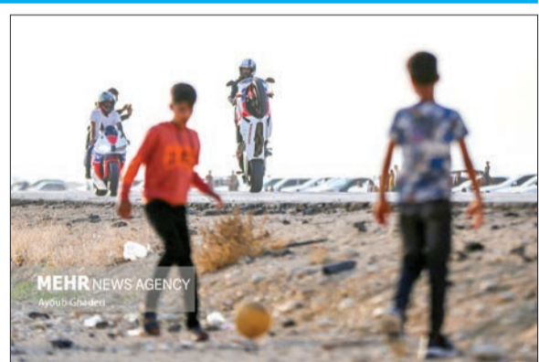
«جاده آومینیوم» که در بین اهالی لامرد به «بیست» شهرت دارد، روزهای جمعه محل تجمع علاقمندان به حرکات نمایشی با موتورهای مسابقه‌ای و خودروها است