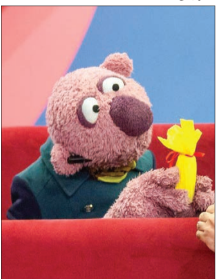
سرشلوغ ماه ظهور دوباره جناب‌خان