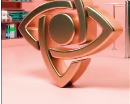
تغییر ماه آگهی بازرگانی با موسیقی جدید

سرتیاج ماجرا | «مستوران ۲» علاوه بر این که داستان عشق، خیانت، دوتل آمده‌ها و مسائلی از این دست را در خود دارد، نقد اجتماعی-سیاسی را فراموش نکرده. نمونه‌اش خود به قاضی فاسد یا دیگر مسئولان پول پرست و قدرت طلب شهر خیالی مستوران.