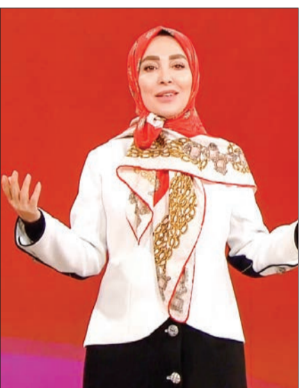
سقوط ماه یک آمار تکان دهنده

سرتیاج ماجرا | «گناه فرشته» به نیمه راه رسیده است و همچنان می‌توان پیش‌بینی کرد که موارد بحث برانگیز دیگری خواهد داشت. پیش‌تر موج‌آفرینی آن در قالب‌هایی چون ترسیم شمایل یک روزنامه‌نگار به بار نشست و حالا در شکل مباحث حقوقی. سریال‌نشان‌های روشن از نقد اجتماعی هم دارد و چه بسا در آینده تیزر شود.