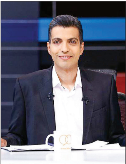
کند و کاو ماه دوباره عادل

سرتیاج ماجرا | ظاهراً همزمان با نوروز جناب‌خان بار دیگر به تلویزیون بر خواهد گشت.