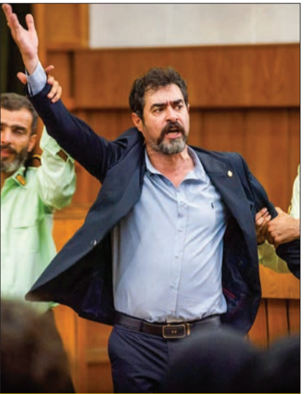
بحث برانگیز ماه و همچنان گناه فرشته

سرتیاج ماجرا | نام مسابقه عوض نشد و دیگر هم کسی حوصله جر و بحث نداشت! پخش «پانتولیگ» در حالی ادامه دارد که نتوانسته انتظار سخت‌پسندا را به دست بیاورد و موج برنامه قبلی گلزار یعنی «برنده باش» را ایجاد کرده. او اما در مقام مجری عملکردی خوب دارد.