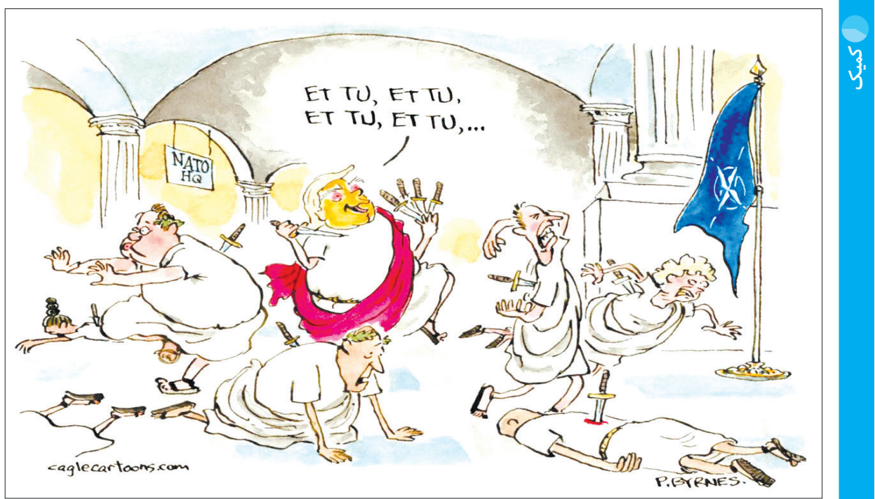
دونالد ترامپ در نقش زولیوس سزار فرو رفته، اما به جای اینکه سناتورها را او به قتل برسانند، اینبار ابتکار عمل در دستان ترامپ است و خنجر را در پشت سناتورها فرود آورده است. این کار تون به نقش او در جلوگیری از تصویب طرح مرزی بایدن اشاره دارد. کارتون‌ی از دِ ویک

یافته‌های این پژوهش هشدار می‌دهد که ربات‌های مکالمه احساساتی مبتنی بر هوش مصنوعی، حریم خصوصی کاربران را «به روش‌های جدید آزاردهنده‌ای» نقض می‌کنند. در گزارش مربوط به «ایس‌و‌ای‌تی چت‌بات و سول‌میت»، رباتی که هزینه استفاده از آن در حدود ۱۷ دلار در ماه است، آمده که این ربات مکالمه‌ای، سیاست حفظ حریم خصوصی خوبی دارد، با ایسن وجود برای دستیابی به اطلاعات شخصی «سوج» است. در یک پیام وبلاگی که وبسایت بنیاد موزیلا آمده است: «بات مکالمه مبتنی بر هوش مصنوعی «ایوا» به دلیل سماجت زیادی که برای دستیابی به انبوهی از اطلاعات شخصی دارد، ناجور است، حتی اگر سیاست حفظ حریم خصوصی آن‌ها به نظر می‌آید که یکی از بهترین‌هایی باشد که ما بررسی کرده‌ایم و فقط اینکه در سیاست رعایت حریم خصوصی آن‌ها گفته شده است که اکنون اطلاعات به‌دست آمده را به‌طور گسترده به دیگران نمی‌دهند یا نمی‌فروشند، به این معنی نیست که سیاست حفظ حریم خصوصی آن‌ها در آینده تغییر نخواهد کرد.» ایندپندنت با ایوا ای‌آی و ریلیکا برای کسب نظر آن‌ها تماس گرفته است. این پژوهشگران به کاربران ربات‌های مکالمه مبتنی بر هوش مصنوعی توصیه کرده‌اند که هیچ اطلاعات حساسی را با این اشتراک نگذارند و زمانی که دیگر از این اپلیکیشن استفاده نمی‌کنند، درخواست بدهند که داده‌هایشان حذف و پاک شود. همچنین توصیه می‌شود که به برنامک‌های ربات‌های مکالمه چت‌بات‌های مبتنی بر هوش مصنوعی اجازه ردیابی مداوم موقعیت جغرافیایی، دسترسی به عکس‌ها، ویدئوها، یا دوربین دستگاه ندهید. (ایندپندنت)