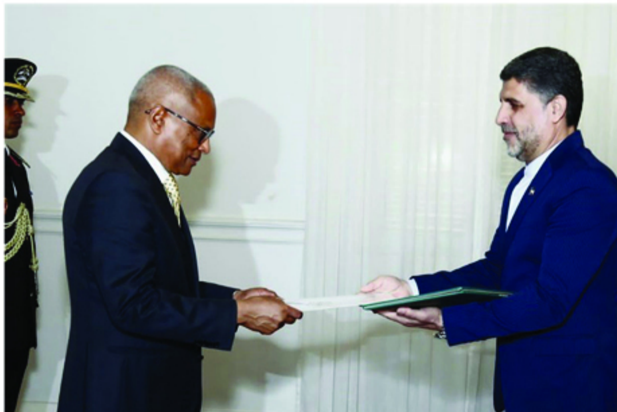
حسن عسکری، سفیر جمهوری اسلامی ایران در سنگال که به عنوان سفیر آکر دیته در دماغه سبز منصوب شده، استوارنامه خود را تقدیم «خوره ماریا نوس»، رئیس جمهور این کشور کرد.

سفیر کشورمان در این دیدار ضمن ابلاغ سلام‌های گرم رئیس جمهوری کشورمان، از وی برای سفر رسمی به ایران دعوت کرد. در این دیدار سفیر کشورمان ضمن اشاره به دستاوردهای ایران در حوزه‌های مختلف، آمادگی جمهوری اسلامی ایران برای همه نوع همکاری با دماغه سبز و به اشتراک گذاشتن تجارب خود را اعلام کرد.