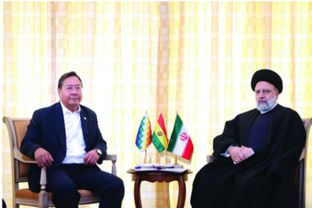
رئیس‌جمهور کشورمان، با تقدیر از مواضع انقلابی و ضدامپریالیستی بولیوی، رویکرد دولت و به ویژه شخص رئیس‌جمهور این کشور در حمایت از فلسطین و ملت مظلوم غزه را ستودنی دانست.

حجت‌الاسلام سید ابراهیم رئیسی عصر امروز شنبه به وقت محلی، در دیدار با «لوئیس آرسه» رئیس‌جمهور بولیوی، با تقدیر از مواضع انقلابی و ضدامپریالیستی دولت و ملت این کشور، رویکرد دولت و به ویژه شخص رئیس‌جمهور بولیوی در حمایت از فلسطین و ملت مظلوم غزه را ستودنی دانست و تأکید کرد: دفاع جانانه شما از فلسطین برای مردم این کشور قطعاً پشتوانه خوبی خواهد بود.