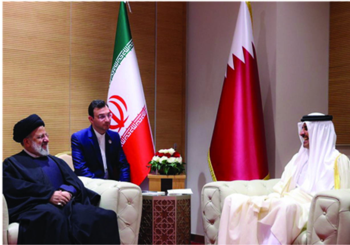
رئیس‌جمهور در حاشیه هفتمین نشست مجمع سران کشورهای صادرکننده گاز با امیر قطر دیدار و گفتگو کرد.

آیت‌الله سید ابراهیم رئیسی بعدازظهر امروز شنبه در حاشیه هفتمین نشست مجمع سران کشورهای صادرکننده گاز که به میزبانی الجزایر برگزار شد، در دیدار شیخ «همیم بن حمد بن خلیفه آل ثانی» امیر قطر با خوب توصیف کردن سطح روابط فیمابین، بر اجرایی شدن هر چه سریع‌تر توافقات صورت گرفته بین دو کشور تأکید و آن را لازمه توسعه بیش از پیش روابط تهران-دوحه دانست.