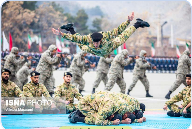
اختتامیه دوره رزم مقدماتی ارتش