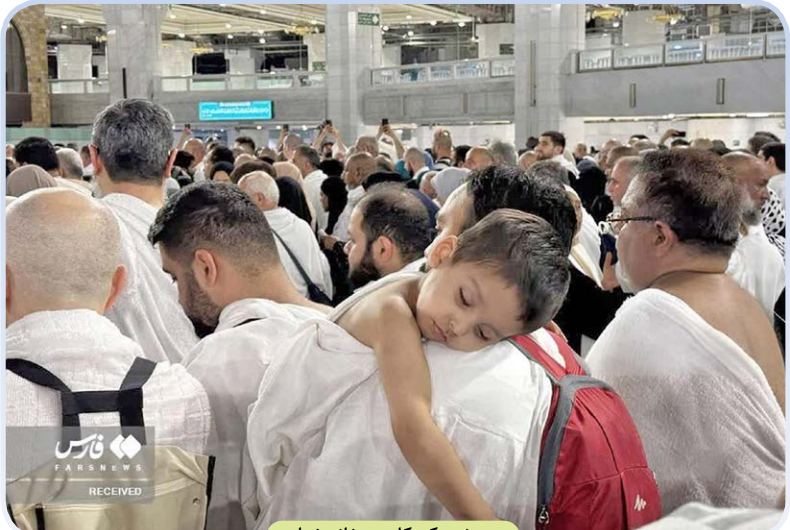
حضور کودکان در خانه خدا