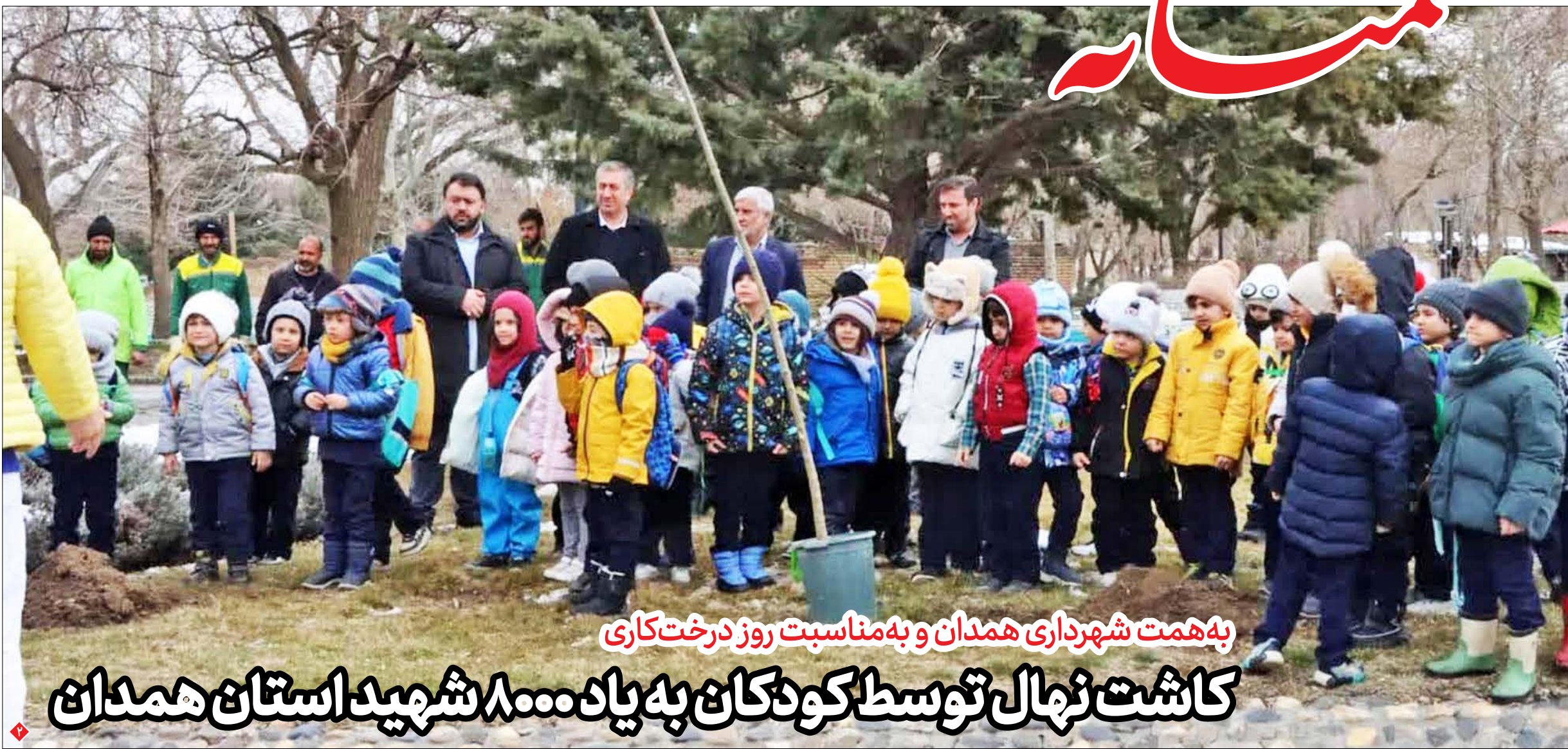
به همت شهرداری همدان و به مناسبت روز درخت‌کاری

رهبر معظم انقلاب: حضور مردم در انتخابات ۱۱ اسفند یک جهاد بود کمک‌ها به سیل‌زدگان سیستان و بلوچستان ادامه پیدا کند