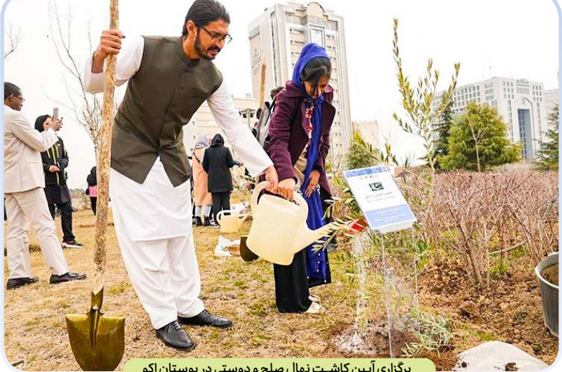
برگزاری آیین کاشت نهال صلح و دوستی در بوستان اگو