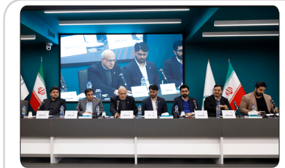
بانک کارآفرین ۵۰ هزار میلیاردی شد

توسعه‌ی بازارهای صادراتی یکی از مهمترین اقدامات برای رونق اقتصادی کشور و برون‌رفت از وضعیت فعلی است؛ اقدامی که با توجه به کاهش چشمگیر ارزش ریال در مقابل دیگر ارزهای رایج در بازار تجارت جهانی، اهمیت دوچندان یافته است. با یک نگاه ساده می‌توان به ضرورت توسعه‌ی بازارهای تجاری کشور پی برد و دانست که تنها با انکاب چند بازار و مراد مالی و اقتصادی با چند کشور، نمی‌توان انتظار شکوفایی اقتصادی داشت. در یک افق کلی باید گفت که کشور نیاز دارد در وهله اول، بازارهای موجود خود را تثبیت کند و در گام بعدی روابط اقتصادی خود را با کشورهای همسوس در عرصه سیاسی و بین‌المللی افزایش دهد. گام سوم، تعمیق روابط تجاری با کشورهای همسایه است و در نهایت باید نگاهی هدفمند به بازارهای جهانی و بین‌المللی نیز داشت. انعقاد تفاهم‌نامه‌های مالی و یا قرار دادهای دو طرفه و چند جانبه می‌تواند در سه مورد اول، چاره‌ساز باشد اما برای حضور در بازار جهانی، نیاز به ارتقاء کیفی محصولات و منطقی کردن قیمت‌ها نسبت به کیفیت است. به عبارت ساده، برای سهم‌خواهی در بازار جهانی باید ضمن احترام به استانداردهای بین‌المللی، محصولی با کیفیت برتر و قیمت منطقی به بازار عرضه کرد و به ویژه اینکه ایران بنا به دلایل مختلف، تحریم است و داد و ستد با طرف ایرانی، به نوعی ریسک‌پذیری طرف خارجی نیاز دارد که این ریسک‌پذیری را می‌توان با ایجاد جذابیت‌های مالی افزایش داد.