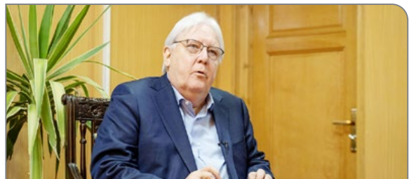
ماریتین کریشتس ؛ معاون دبیرکل سازمان ملل در امور بشردوستانه اعلام کرد که دیگر امکان عملیات بشردوستانه در جنوب غزه وجود ندارد.