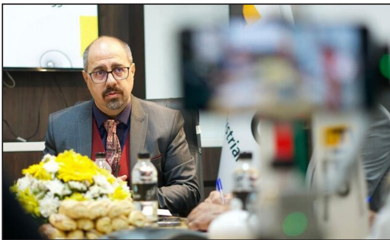
یک فعال صنعت ساختمان گفت: در خصوص همکاری شهرداری تهران با کشور چین برای ساخت مسکن اگر همان تکنولوژی که چین در کشورهای خاورمیانه به کار می‌گیرد در ایران نیز استفاده شود بسیار خوب است.

شده که به افزایش قیمت‌ها در بازار مسکن منجر می‌شود. وی افزود: بانک‌ها در مزایده‌ها خرید و فروش‌های با قیمت‌های حباب‌گونه و کاذبی انجام می‌دهند تا جریان ورشکستگی دارایی‌هایشان را انجام دهند. در غیر این صورت وثیقه‌هایشان توسط بانک مرکزی به اجرا گذاشته می‌شود. نقض دلار، وابستگی ۲۵۰۰ کالا با مسکن و دومینو تومی در این بازار یوسفی افزایش قیمت ارز را عاملی برای رشد قیمت مسکن دانست و گفت: با توجه به افزایش نرخ ارز و وابستگی بودجه دولت به دلار، افزایش نرخ دلار باعث رشد حباب‌گونه