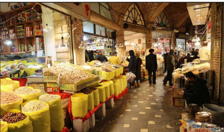
در حالی که مردم با حضور خود در پای صندوق رای در یازدهم اسفند، پیام خود به همه مسئولان و افراد تصمیم‌گیر و تصمیم‌ساز کشور مبنی بر لزوم وحدت و تمرکز بر حل مشکلات اقتصادی را مغایره کردند. اما برخی از جریان‌های سیاسی شکست خورده با مغرض در جهت انتقام‌گیری از این حضور از هر گاهی کوه میسازند و فضای رسانه و بالطبع جامعه را ملتهب می‌کنند و نمونه آن تحریف سخنان مخیر در راستای کنترل بازار شب عید و ماه رمضان است که مدعی شدند دولت بازار را به حال خود رها کرده و به بازاربان سپرده است.

دولت از بازاربان این است که به ویژه برای عید نوروز و ماه مبارک رمضان نسبت به نظرات و کنترل قیمت‌ها توجه جدی داشته باشند. اما برخی جریان‌های سیاسی که تاکنون حضور مردم پای صندوق رای را تخریب می‌کردند؛ با تحریف سیاسی مخیر مدعی شدند که دولت بازار را به حال خود رها کرده و به بازاربان سپرده است!