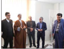
کاهش اطاله دادرسی برنامه محوری دادگستری

اصفهان سرپرست دانشگاه علمی و کاربردی تیران از معرفی هفت ایده نوین و برتر در فرآوری صنایع و تولیدات صنعت سنگ کشور در رویداد علمی ایده‌های نوین خبر داد. ۷ ایده نوین شامل: ساخت کاشی از سنگ، معرّفی و دفاع از آن را دریافتند. سرپرست دانشگاه علمی و کاربردی تیران دستاوردهای این رویداد را فرصتی برای رونق صنعت سنگ از نگاه نوآوری و رونق تولید بیان کرد و یادآور شد: فرصت‌ها و امکاناتی که برای ایده‌های منتخب دیده شده که سرمایه‌گذاران از آن محبت خواهند کرد و گواهی حضور در رویداد به شرکت کنندگان همراه با جوایز نفیس احدا شد.