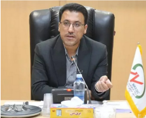
اهتمام دستگاه ها در تامین زیر ساخت های نهضت مسکن