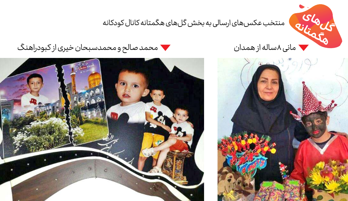
منتخب عکس‌های ارسالی به بخش گل‌های هگمتانه کانال کودکان محمد صالح و محمد سبحان خیری از کیودراهنگ