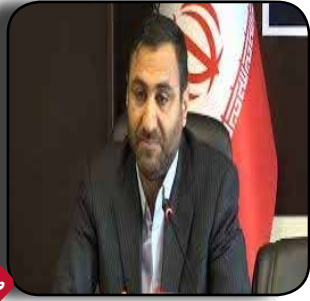
راه اندازی ۹ شبکه تبلیغاتی برای ۹ حوزه انتخاباتی مازندران در صدا و سیما