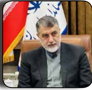
فرهنگ ایثار و شهادت موجب توفیق ملت ایران در همه صحنه هاست