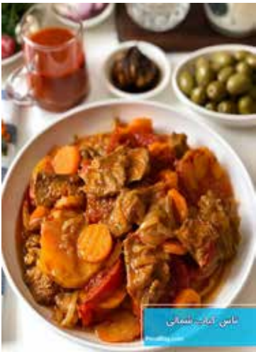
تاس کباب شمالی

تاس کباب شمالی یکی از روش های تهیه این خوراک خوشمزه و سنتی ایرانی می باشد که می توانید به سادگی آن را در خانه تهیه کنید. تاس کباب شمالی یا تاس کباب گیلانی طعم فوق العاده دارد و با گوشت تکه ی تهیه می شود. شما می توانید این خوراک خوشمزه ایرانی اصل را در خانه تهیه کنید و برای شام یا نهار سرو کنید. تاس کباب شمالی را می توانید به روش های مختلفی بپزید، می توانید برای سریع تر پخته شدن از زودپز استفاده کنید و یا می توانید در فر به صورت تنوری آن را تهیه کنید و یا به صورت ساده و لایه ی در قابلمه بگذارید تا پخته شود.