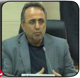
مصرف گاز در گلستان به بیش از ۱۶ میلیون مترمکعب رسید