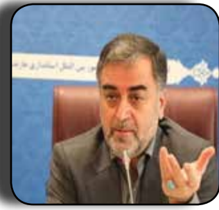
برگزاری جام کشتی «سید رسول حسینی» در مازندران