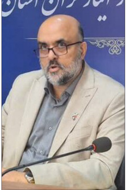
مدیرکل بنیاد شهید و امور ایثارگران گلستان