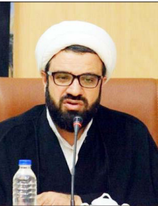
مدیرکل بقاع و اماکن مذهبی سازمان اوقاف و امور خیریه

مدیرکل بنیاد شهید و امور ایثارگران گلستان به ارائه خدماتی درمانی بیمه دی به جامعه ایثارگری اشاره کرد