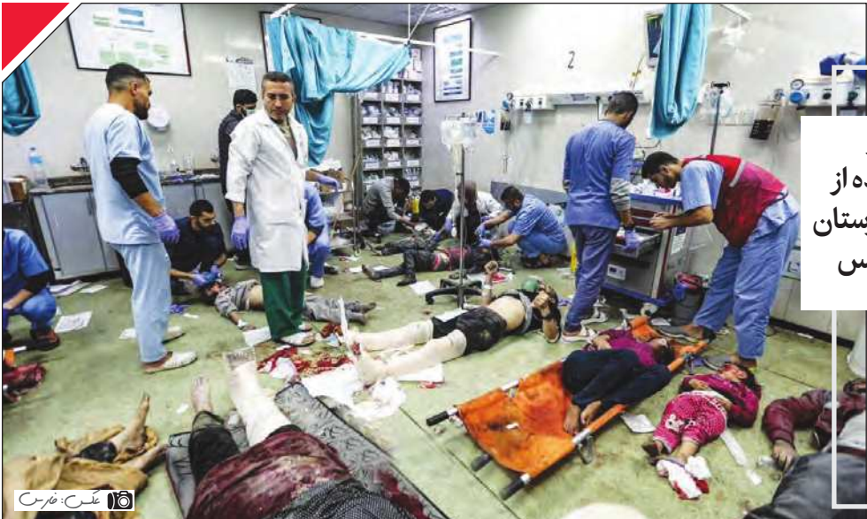
تصویر شرایط بیمارستان در خانیونس