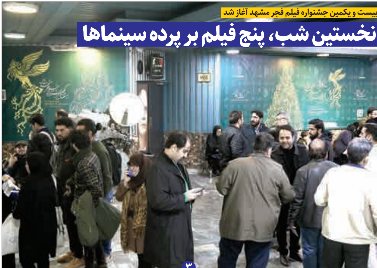
بیست و یکمین جشنواره فیلم فجر مشهد آغاز شد