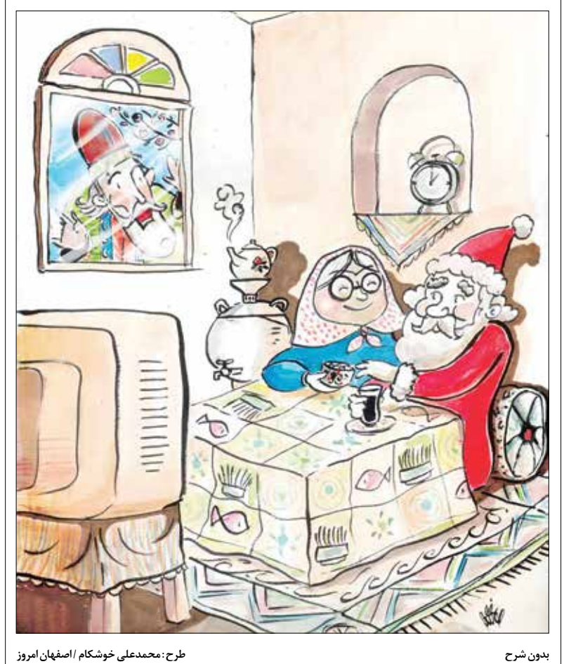
بدون شرح / طرح: محمدعلی خوشکام / اصفهان امروز

میشم نمکی: پارسایان، خوششان، رجا است و رجاشان با خفتناکی و خشیت همراه است. عبادتشان برای اطاعت و بندگی است و تابندگی شان از سر اخلاص و خلوص است. تقویان، همواره در مسیر هدایت گام برمی دارند تا به «رشد» و «بلندگی» و به «تعالی» و «پایندگی» برسند. رسیدن به قله، هم توشه می خواهد، هم کوشش طلب می کند و هم ایمان به هدف می طلبد.