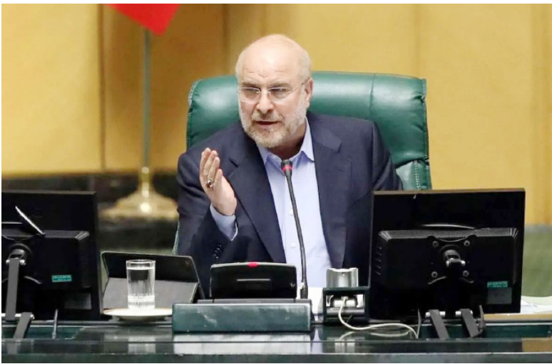
رئیس مجلس شورای اسلامی گفت: اگر قانون در جامعه مبنای تصمیم‌گیری نباشد، جامعه دچار چالش، کندروی، تندروی و انحراف می‌شود و فرصت‌ها از دست می‌رود.

یازدهم به سهم خودمان تلاش کردیم در این بستر حرکت کنیم. اگر امروز چالش‌هایی در بخش‌های مختلف همچون حوزه حکمرانی، اهل بیت زندگی می‌کنیم. این نعمت بسیار عظیمی برای ما محسوب می‌شود. رئیس مجلس شورای اسلامی با اشاره به تأکیدات امام و مقام معظم رهبری مبنی بر وجود تحول اظهار کرد: مکتب امام بر سه پایه معنویت، عقلانیت و عدالت است. اگر در کشور ثبات و تحولی رخ دهد باید برپایه این مکتب باشد. تحول نیازمند توازن هم است و وقتی تحول رخ می‌دهد که بر سه پایه قانون‌شکنی نشویم. این وقتی رخ می‌دهد که قانون از جامعیت لازم برخوردار نباشد و با شرایط جامعه منطبق نبوده و قابلیت اجرایی نداشته باشد. از همین جهت است که رهبری سیاست‌های کلان قانون‌گذاری را اعلام کردند