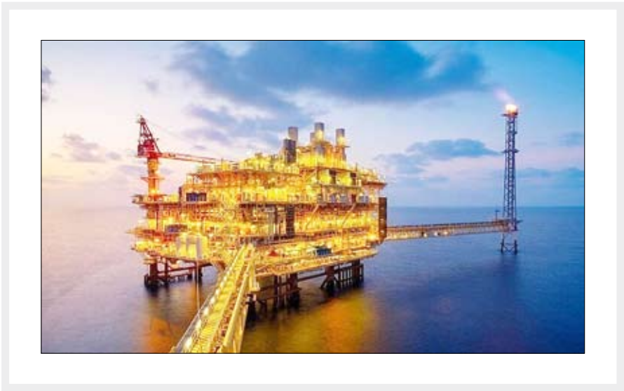
یکپارچه میادین مشترک نفت اظهار داشت: اولاً با عراق در