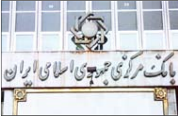
بانک مرکزی جمهوری اسلامی ایران