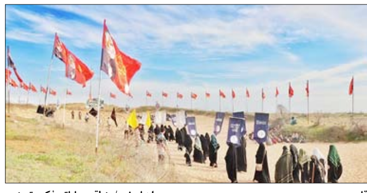
قاب روز / سرزمین راهبان نور / منطقه عملیاتی فکه

آیین نامه اخلاق حرفه‌ای «تجارت» را در سایت روزنامه ببینید.