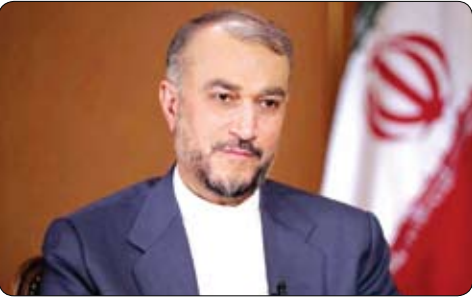
۱۰ همین صفحه

امیر عبداللّهیان: رژیم صهیونیستی عامدانه سیاست نابودی فلسطین را دنبال می کند