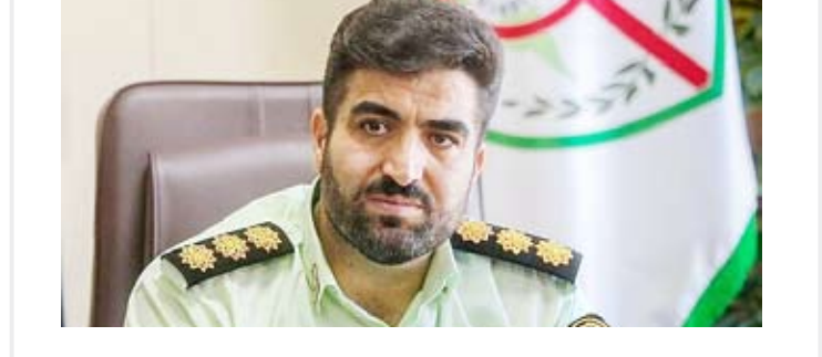
کلاهداری ۵ میلیاردی با کپی کارت بانکی در پمپ‌بنزین

رئیس پلیس فتای تهران بزرگ از انهدام بانده ۴ نفره کلاهداری اسکیم در پایتخت خبر داد و گفت: کلاهداران از این طریق ۵ میلیارد تومان کلاهداری کرده‌ بودند. سرهنگ داوود معظمی گودرزی در گفت‌وگو با ایسنا، درباره دستگیری اعضای بانده کلاهداری به روش اسکیم گفت: در ایام نزدیک به عید نوروز با افزایش خریدهای نوروزی کلاهداری‌های اسکیم یا کپی کردن کارت بانکی نیز افزایش پیدا می‌کند. در این روش کلاهداری، افراد سودجو به صورت‌های مختلف اقدام به دست آوردن کارت‌های بانکی و پرسیدن رمز کرده، سپس با کپی کردن کارت با عکس گرفتن از آن می‌توانند با داشتن رمز کارت اقدام به برداشت از حساب بانکی افراد کنند. رئیس پلیس فتای پایتخت ادامه داد: با اقدامات شبانه روزی همکاران ما، چهار نفر که با تشکیل یک بانده اقدام به کلاهداری به روش اسکیم کرده برداشت از حساب کرده بودند.