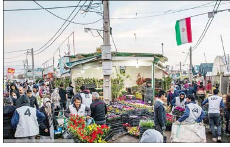
بازار گل محلاتی در آستانه عید نوروز

دریای خزر بارش باران و کاهش دما در نیمه غربی سواحل شمالی پیش‌بینی می‌شود. همچنین غرب دریای خزر موج خواهد شد. به گفته وی، در روز سه شنبه، وزش باد شدید در مناطقی از مرکز جنوب و شرق کشور موجب خیزش گردوخاک می‌شود. رئیس مرکز ملی پیش‌بینی و مدیریت بحران مخاطرات وضع هوا درباره وضعیت جوی تهران طی دو روز آینده نیز گفت: فردا شنبه ۲۶ اسفندماه آسمان تهران ابری است و در برخی ساعات، رگبار، غبار و برف و گاهی وزش باد خواهد داشت با حداقل دمای ۱۱ و حداکثر دمای ۱۸ درجه سانتی‌گراد. همچنین یکشنبه ۲۷ اسفندماه نیز آسمان تهران کمی ابری است و در برخی ساعات وزش باد شدید می‌شود و حداقل دمای ۹ و حداکثر دمای ۱۹ درجه سانتی‌گراد پیش‌بینی می‌شود.