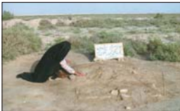
مادر یاسی از شهیدای لشکر ۲۷ محمد به‌پوش الله (ع) در کنار آستانه حشران گناباد شهید. قریب پس از صافه با زبان نغمه‌وار از زبان باشه‌پوش و سرقری‌های دست چپش معافون گوی. مکنش سرمد تا فرزند

می‌شویم که می‌خواهند فرزندگی روزمره جنگ و دفاع را جای نهدند یعنی در نگاه‌های بی‌زبان نگره و زبان نگره و زبان جنگ برای ما سرگرم و سرگرم برابر با تمام شدن و نابودی نیستند، بلکه زبان حیات طبیعی‌ای را معنا می‌بخشند که در روایات و قرآن کریم به آن اشاره شده است. لفظی جدید این معنایان، جهان مادی نیست که اگر با پدیده‌های مثل جنگ مواجهه و مجبور شدند فرزندان خود را از غمی بیستند، یا حتی جسم می‌آیند آن‌را در گوش بگیرند این اتفاق با زبان زندگی و هستی‌شان باشد. البته که در درناک‌است ولی این نوع از زبان و پستی برای ارتقای روحی و تعریف جدیدی از هستی می‌بینند که مختص این زبان‌ها و فکری و گفتار است. زبان نگره بر خلاف این که با خودت‌ها و با ناهای خام‌ان‌سوز مواجه‌اند، ولی همچنان برای ادامه زندگی تلاش می‌کنند.