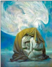
↑ تالووی نقاشی اصحاب کساء صحن روح لاهوت

خداوند! برای عاقبت و ناپوش ستایش کنی. هر کس که سر آسمان ها و زمین است، برای رسیدن به اود خدای وسیله ای است. ما سر جهان بندگانش وسیله اویم و خواص اویم و جایگاهش اویم و ما صحبت اویم و قریب اویم و سایر ایشان و یارانش او هستیم.