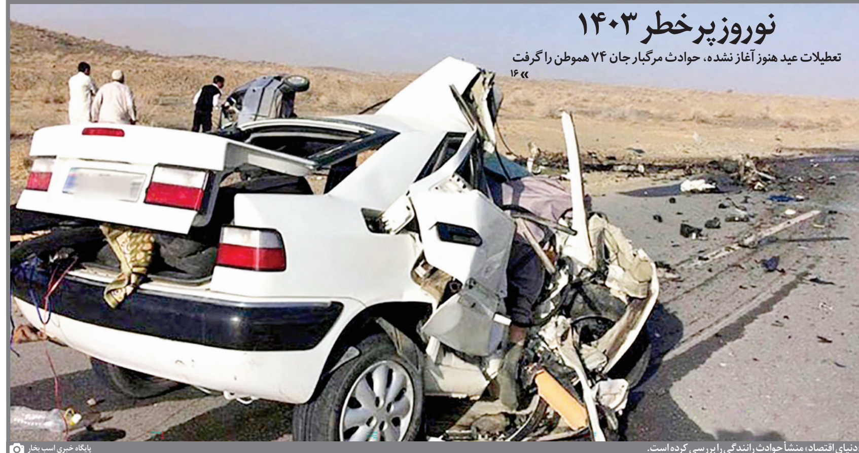
دنیای اقتصاد، منشأ حوادث رانندگی را بررسی کرده است.

کروند نیز بیشتر است. کارشناسان معتقدند که مهم ترین عامل افزایش میزان ترک تحصیل در سال های گذشته فقر در یک دهه اخیر بوده است. نرخ فقر در سال ۱۴۰۱ به ۳۰ درصد رسیده است و بسیاری از مردم ایران توانایی تامین نیازهای ابتدایی خود را نیز ندارند و این مساله بر تحصیل فرزندانشان موثر است. بنابراین