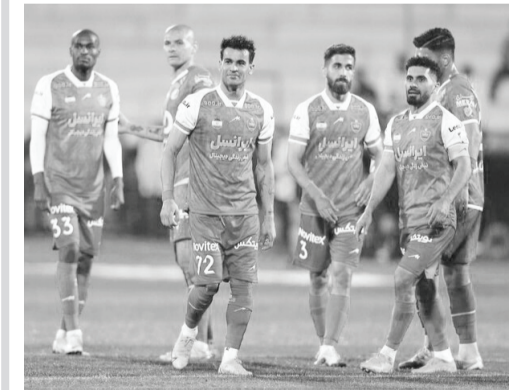
سیزدهم فروردین می‌تواند به میادین بازگردد.

عوض می‌شود و ۵–۲–۳ بازی می‌کنند. باید طبق بازی‌ها برنامه کاری مان را انجام بدهیم. مهم است بعد از شهرآورد یک بازی خوب انجام بدهیم و سه امتیاز لازم را به دست بیاوریم. این پنجمین بازی است که در جدول فشرده بازی داریم و امیدواریم خوب نتیجه بگیریم و بازیکنان در شرایط ایده‌آل خود باشند. سرمربی پرسپولیس در مورد اینکه هواداران فوتبال از کیفیت شهرآورد راضی نبودند، بزرگ‌ترین درسی که از شهرآورد گرفتید تا در ۱۰ بازی آخر لیگ از آن استفاده کنید چه بوده، گفت: بازی صفر بر صفر برای هیچ تماشاگری