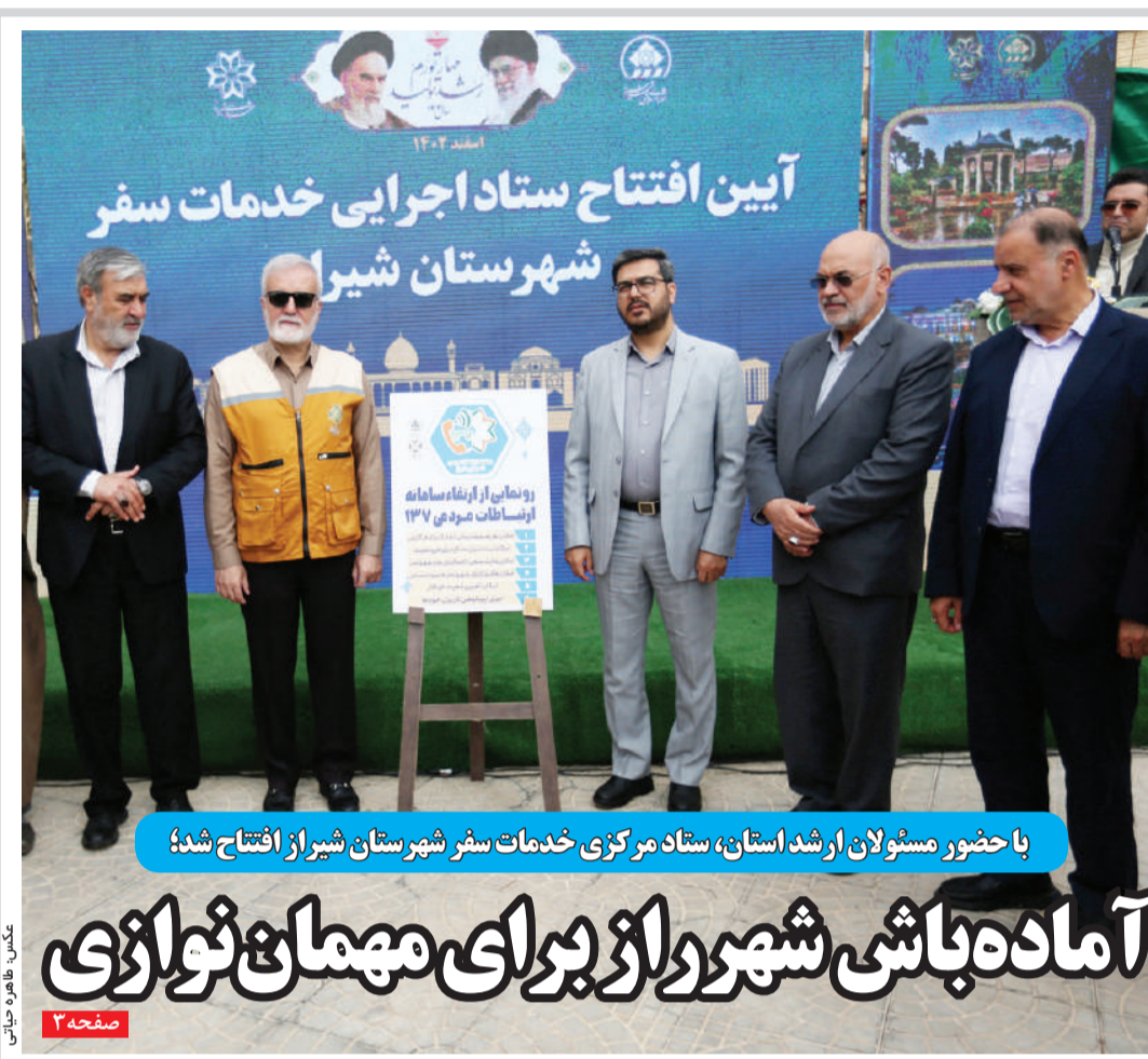
با حضور مسئولان ارشد استان، ستاد مرکزی خدمات شیراز افتتاح شد