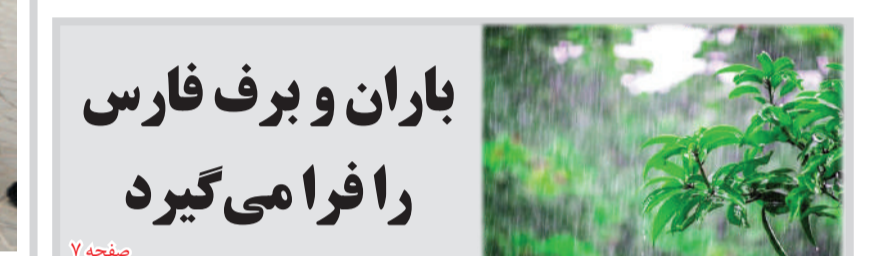
باران و برف فارس را فرامی گیرد