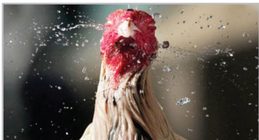
خروس جنگی - فلپپین