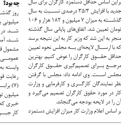
با وجود حجم بارندگی‌های

کَزارشِ خَبری- لَیلا غَضَظری سال گذشته بود که پس از کش‌وقوس‌های چند ماهه و بدون رضایت نمایندگان کارگری در شورای عالی کار، حقوق و مزایای کارگران برای سال ۱۴۰۳ تعیین شد. براین اساس حداقل دستمزد کارگران برای سال جدید با افزایش ۳۵/۳ درصدی نسبت به سال گذشته به میزان ۷ میلیون و ۱۸۲ هزار و ۱۰۶ تومان تعیین شد. اتفاق‌های پایانی سال گذشته منجر به این شد که وزیر کار به این نتیجه برسد که با ارسال لایحه‌ای به مجلس نحوه تعیین حداقل حقوق کارگران را عوض کنیم. بهترین مرجع برای تصمیم‌گیری حقوق کارگران مجلس است. وی ادامه داد: مجلس با گرفتن نظر نمایندگان کارگری و کارفرمایی و وزارت کار در مورد حقوق کارگران تصمیم می‌گیرد و آن را در لایحه بودجه می‌گنجاند. بر اساس اعلام وزارت کار میزان افزایش دستمزد