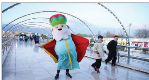
در حاشیه بازدید اصحاب رسانه از برج میلاد تهران