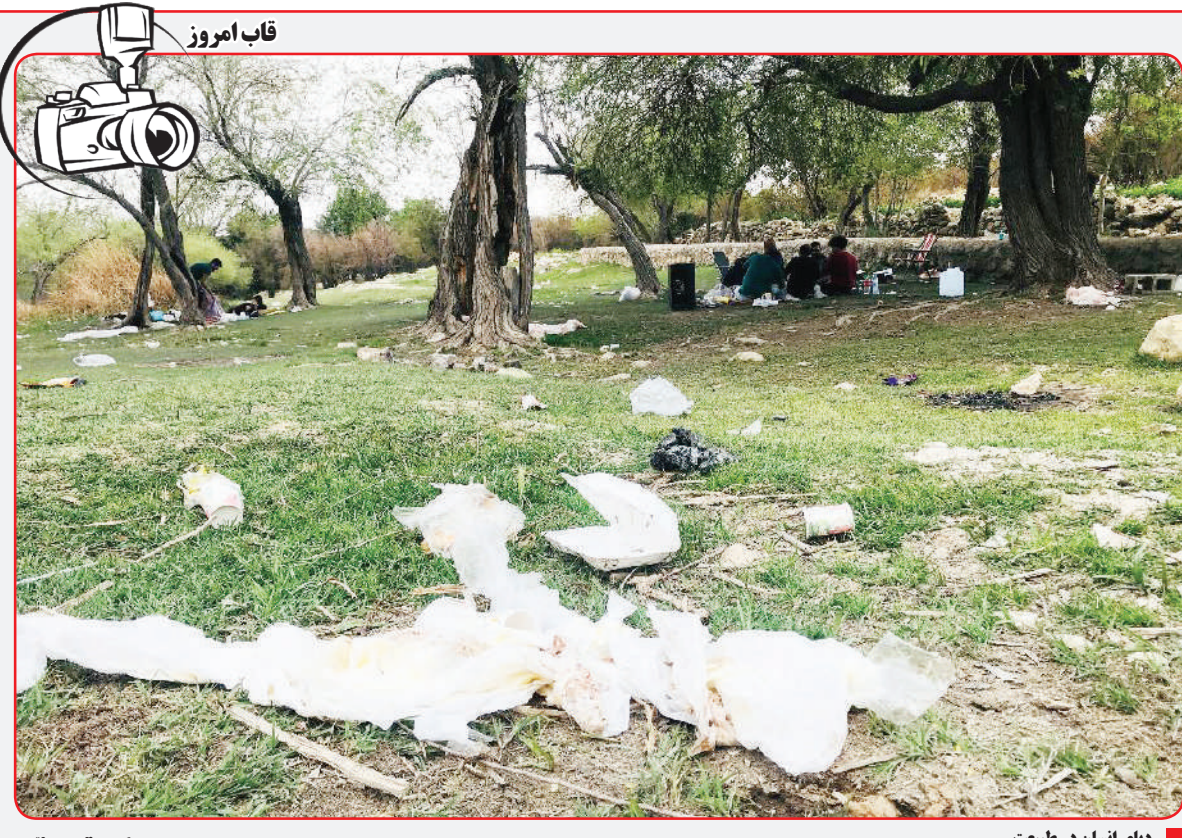
ردبای انسان در طبیعت

در طول این سال‌ها نسخه‌های سفارشی بسیار جذابی از هارلی دیویدسون بریک اوت تولید شده‌اند و به نظر می‌رسد از زمان معرفی نسخه جدید این موتورسیکلت