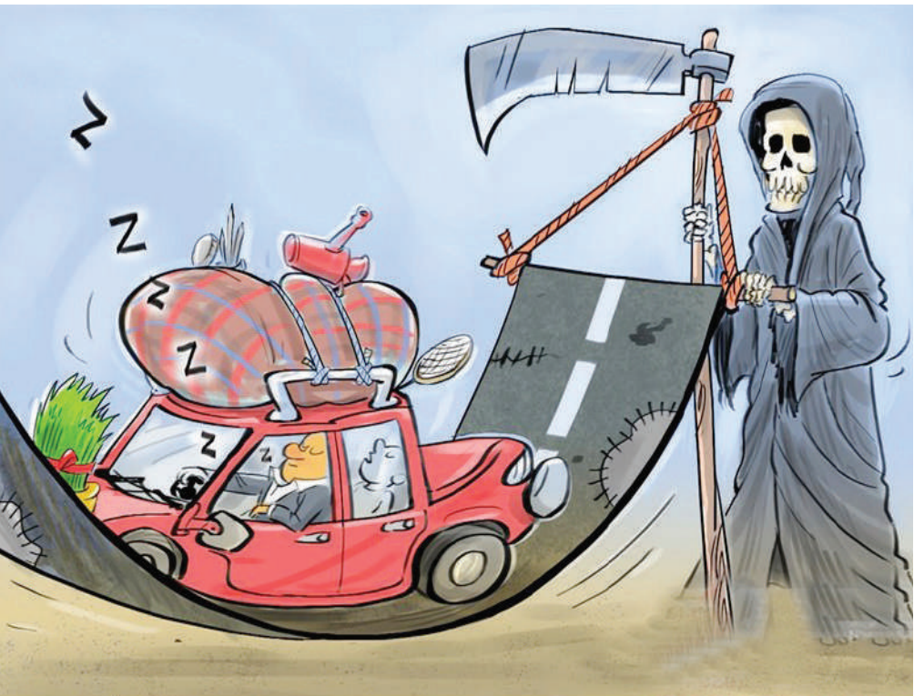
خستگی و خواب‌آلودگی و تصادفات نوروزی