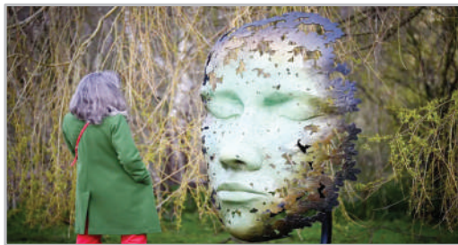
نمایش مجسمه روح برگ - انگلیس