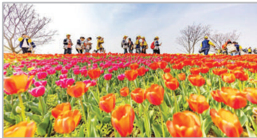
شکوفه‌های گل در نزدیکی تالاب دریاچه هونکنز - سوچیان چین