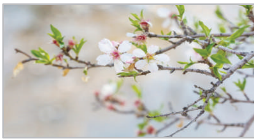
شکوفه‌های بهاری - قزوین