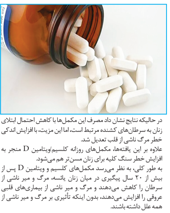
در حالی‌که نتایج نشان داد مصرف این مکمل‌ها با کاهش احتمال ابتلای زنان به سرطان‌های کشنده مرتبط است، اما این مزیت، با افزایش اندکی خطر مرگ ناشی از قلب تعدیل شد.

علاوه بر این یافته‌ها، مکمل‌های روزانه کلسیم/ویتامین D منجر به افزایش خطر سنگ کلیه برای زنان مسن‌تر هم می‌شود. به‌طور کلی، به نظر می‌رسد مکمل‌های کلسیم و ویتامین D پس از بیش از ۲۰ سال پیگیری در میان زنان پانصد، مرگ و میر ناشی از سرطان را کاهش می‌دهند و مرگ و میر ناشی از بیماری‌های قلبی عروقی را افزایش می‌دهند، بدون اینکه تأثیری بر مرگ و میر ناشی از همه علل داشته باشند.