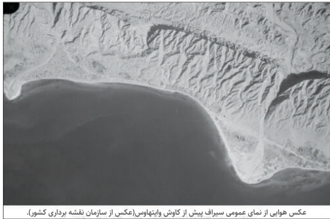
عکس هوایی از نمای عمومی سیراف پیش از کاوش و این‌هاوس.