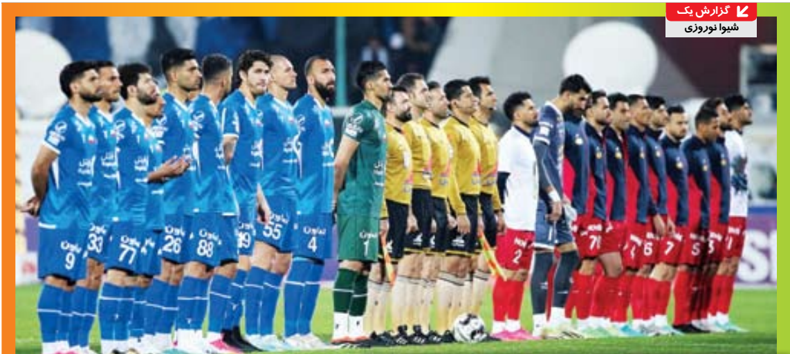
سهام پرسپولیس عرضه شد، اما هیچ خریداری پای معامله نیامد