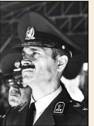
شهید سرلشکر ولی‌الله فلاحی

«از آغاز طلوع جنبش اسلامی ایران به رهبری حضرت امام خمینی، سرداران فدائکار و اینارگری در مسیر خونبار این معجزه بزرگ قرن، چون آذرخش شب درخشیدند و بر سر بیمنایی که با خدای خویش بسته بودند، در جهت تحکیم پایه‌های این قیام خونبار و دفاع از کبان انقلاب و پاسداری از سرزمین شفق و شهادت، جان بر کف قدم در میدان مبارزه گذاشتند و اینار را سرلوحه‌ی خویش قرار دادند. چراکه می‌دانستند شهادت در این راه، رستگاری برای آنها است. از ویژگی‌های این سلحشوران و سرداران انقلاب، پاک‌ی نیت و عمق خلوص آنها و همچنین همسویی این دلیران با اندیشه‌های امام خمینی است. این همسویی و اطاعت آگاهانه که سبب تأثیرپذیری کامل می‌گردد، تا جایی می‌تواند به پیش رود که عوامل تأثیرپذیرنده به عواملی کاملاً تأثیرگذار تبدیل شوند و مانند اجزایی کارساز و فعال، هم‌جهت با انقلاب و هم‌سو با رهبری به یک جریان تبدیل گردید به‌جریان‌سازی در جامعه (به ویژه در نهاده‌ی که در آن خدمت می‌کنند) بپردازند. سرلشکر شهید ولی‌الله فلاحی از جمله افراد تأثیر‌گذاری بود که در یکی از مقاطع بحرانی و