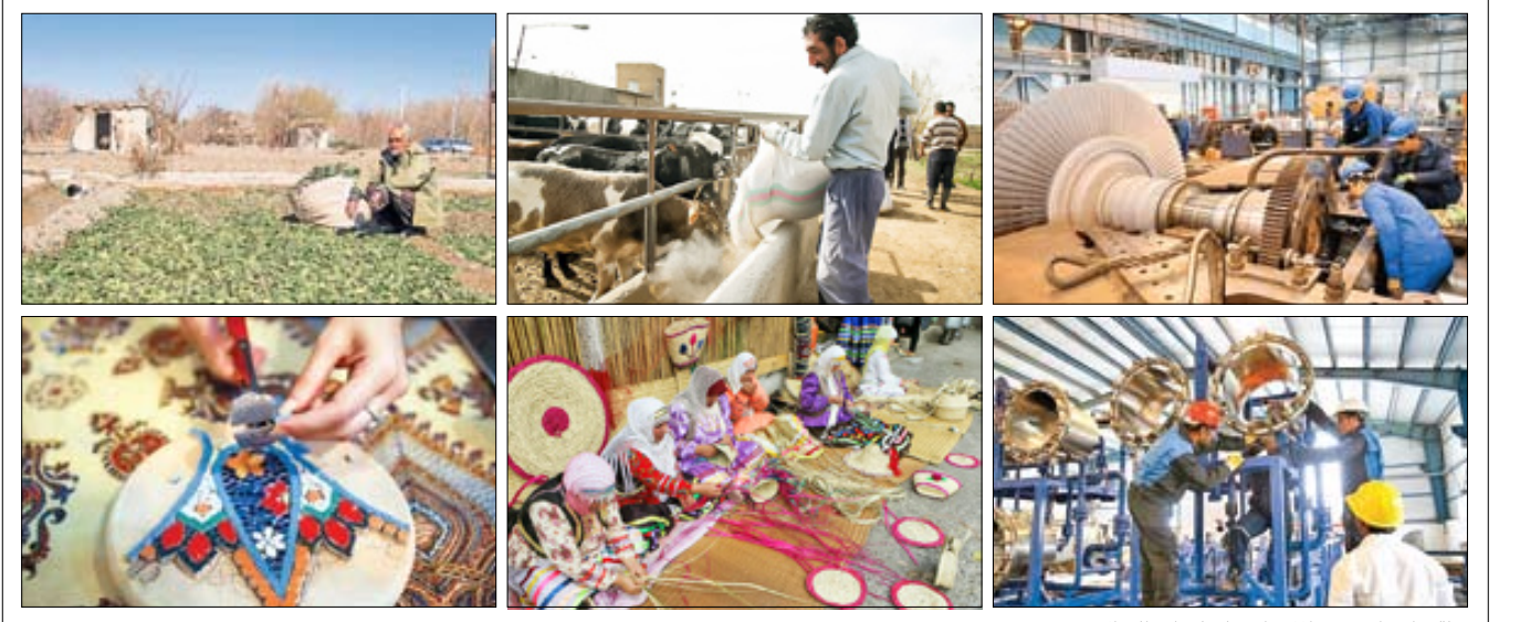
اقتصاد مقاومتی مشاغل زیادی را در استان‌ها احیا کرد

حضرت آقا فرموده‌اند: هر وقت مردم پای کار می‌آیند مشکلات خیلی سریع‌تر و راحت‌تر رفع می‌شود. ما نیز می‌گوییم مردم باید خودشان بدانند چه گرفتاری‌هایی دارند و وقتی گروهی درصدد یاری‌رساندن به آنها برمی‌آیند، خودشان هم گوشه‌ای از کار را بگیرند.