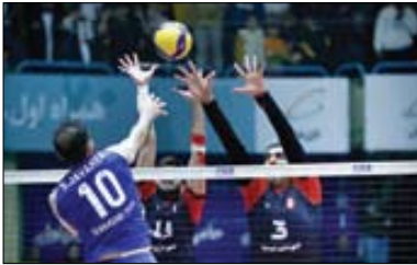
آغاز روزشمار پایان لیگ والیبال