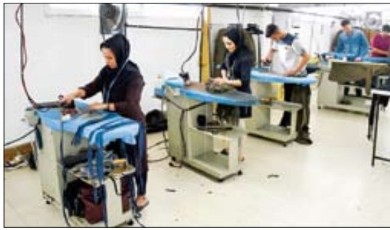
گفت و گو «جوان» با کارآفرین ایلامی

این بانوی تولیدکننده از سال ۱۳۹۹ به صورت حرفه‌ای