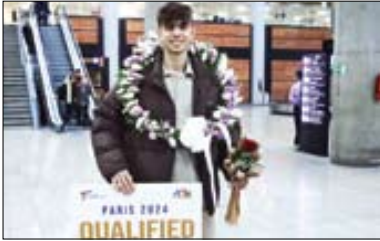
آغاز خوب سال نو برای توکاندو