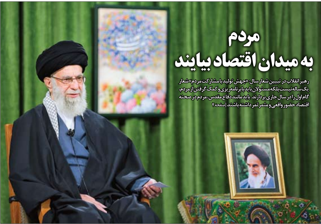
■ رهبر معظم انقلاب، امسال را نیز با شعار اقتصادی، هدایت کردند. مطابق با این هدایت، اقتصاد باید کاملاً مردمی شود | Khamenei.ir

رهبر انقلاب در تبیین شعار سال: «جهش تولید با مشارکت مردم» شعار یک‌ساله نیست بلکه مسئولان باید با برنامه‌ریزی و کمک گرفتن از مردم، گام اول را در سال جاری بردارند. باید مانند دفاع مقدس، مردم در صحنه اقتصاد حضور واقعی و مشمیر ثمر داشته باشند | صفحه ۲