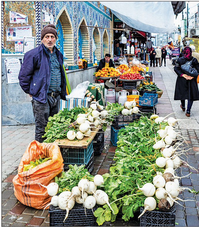
گیلان - بازار رضوانشهر