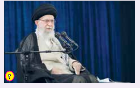
رهبر معظم انقلاب اسلامی پس از کاشت سه اصله نهال در روز درختکاری با اشاره به انتخابات ۱۱ اسفند:

پنجشنبه هفدهم اسفند ماه ۱۴۰۲ ■ شماره ۱۶۶ (پیاپی ۲۰۱) ■ ۸ صفحه ■ سال هشتم ■ قیمت ۱۰۰۰۰ تومان