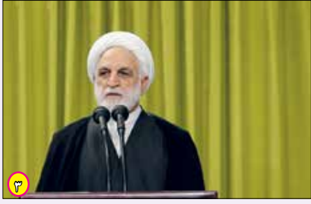
از محول کردن امور قضایی به سال آتی بپرهیزند