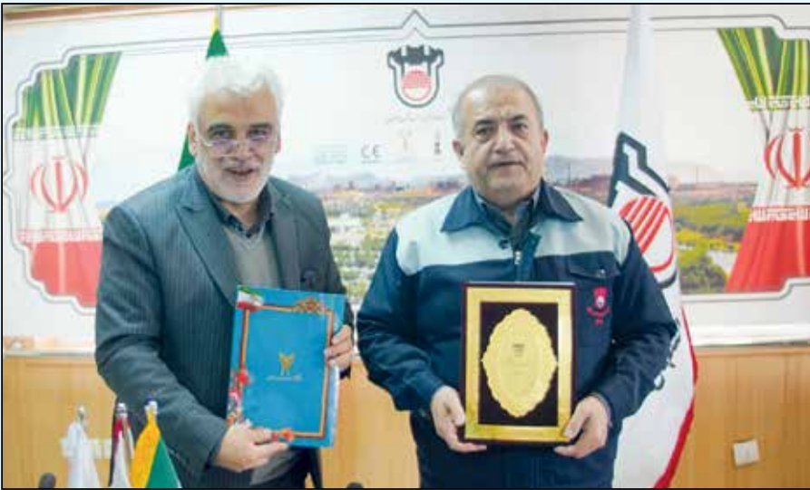
از جمله ریل، تیر آهن‌های بال‌پهن، آرک و ... را متناسب با نیاز بازار افزایش می‌دهیم. مدیرعامل ذوب آهن اصفهان اظهار

اصفهان نیز با اشاره به تعامل بسیار خوب این صنعت با دانشگاه آزاد اسلامی گفت: بر اساس ۲۱۱ پایان‌نامه و رساله‌ای که در سطوح کارشناسی ارشد و دکتری در دانشگاه آزاد با موضوعات مورد نظر ذوب آهن اصفهان تهیه شده است، به زودی سمیناری بر گزار می‌شود تا بتوانیم ارتباط صنعت و دانشگاه را به سمت پروژه‌های دانش بنیان سوق بدهیم. با توجه به برنامه دانشگاه آزاد در جهت ساخت مسکن برای اعضای هیات علمی و کارکنان خود، اعلام آمادگی کردیم که محصولات طولی ساختمانی به ویژه تیر آهن‌های بال‌پهن جهت انبوه‌سازی برای این دانشگاه ارائه کنیم.