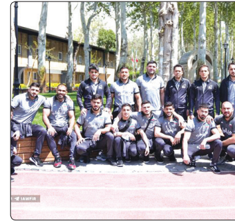
تیم ملی کشتی آزاد برای حضور در رقابت‌های کشتی

تایلند به روی تخته می‌رود در بهترین حالت می‌تواند