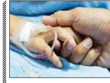
وجود ۱۱۰۰ بیمار هموفیلی در استان اصفهان

مدیرکل انتقال خون استان اصفهان از وجود بیش از ۱۱۰۰ بیمار هموفیلی در این استان خبر داد و گفت: کاهش آلام بیماران و پشتیبانی از سلامت و درمان بیماران نیازمند به خون با تأمین خون و فرآورده سالم و کافی، مسئولیت اداره کل انتقال خون است. کاین حدس‌ها برآورده‌ای از وضعیت بیماران و پشتیبانی از سلامت و درمان بیماران نیازمند به خون با تأمین خون و فرآورده سالم و کافی، مسئولیت و مأموریت اصلی اداره کل انتقال خون است و تلاش می‌شود تا با افزایش کیفیت و کمیت خون و فرآورده‌ها به این مهم دست پیدا کنیم.