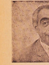
اعطای نشان تاج آقای دکتر امینی نخست وزیر در روز چهارم آبان مورد مرحمت مخصوص شاهنشاه قرار گرفتند و بدریافت نشان تاج از درجه اول که از بزرگترین نشان ایران است مستقر شدند

در جشن فرخنده میلاد مسعود شاهنشاه روز چهارم آباناه در مراسم رسمی کاخ گلستان شهردار تهران آقای دکتر نصر خطابه فرایی بناسبت روز مسعود مولود شاهنشاه معروض داشتند که مورد توجه و عنایت خاص ملوکانه قرار گرفت در زیر متن خطابه آقای شهردار برای مزید اطلاع نشر می یابد