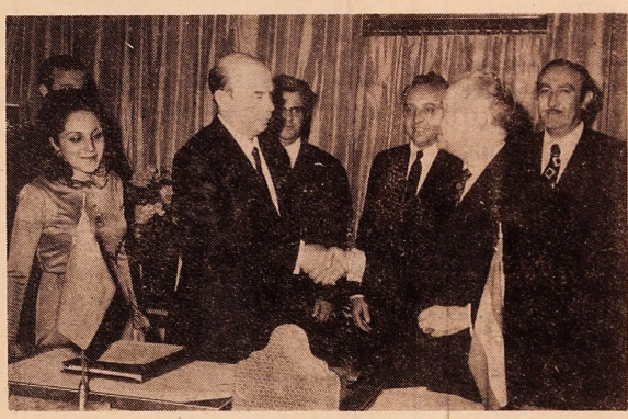
امضاء پروتکل ایران و شوروی در وزارت خارجه

بشار شاهنشاه و شهبانو از مشهد سفر میمنت اثر علیحضر تین شاهنشاه و شهبانو با اتفاق حضرت قاجار و عیال در مشهد مقدس به راهی برای اهالی خراسان می باشد مقدس مسووح خیر و برکت و شادمانی و مبادی بود و اعتقادو ایمان شاهنشاه به مبادی و معنوی مورد ستایش و قدردانی قرار گرفت در این راه و چون که کوتاه بود معذالک شاهنشاه به بسیاری از امیران و اصلاح سرزمین خراسان تحفه توجه و امانت نام بوده و دستورات اکیدی برای رفع نقایص و پیشرفت دادن فرمودند