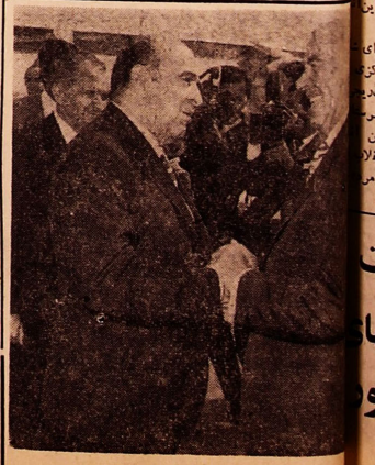
ایمان از آقای هویدا نخست‌وزیر در بخارست

ستی ایران و رومانی هویدا نخست‌وزیر یک بازدید شش روزه به کشور رومانی و وزیر رومانی برای بقیه در صفحه ۴