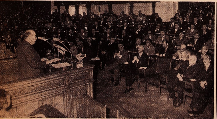
آقای هویدا نخست وزیر گزارش اعزام نیروهای مسلح شاهنشاهی و اسفراز آنهار در جزایر خلیج فارس را با اطلاع مجلسین رساندند

تصمیم قانونی مجلس سنا مجلس سنا در جلسه نهم آذرماه ۱۳۵۰ پس از استماع گزارش و توضیحات آقای هویدا نخست وزیر راجع باستقرار نیروی و مسلح شاهنشاهی در جزایر خلیج فارس مراتب سپاس عمیق و تشکرات صادقاله ملت ایران به پیشگاه اعلیحضرت محمد رضا شاه پهلوی آریامهر از توجهات عالیه آن شهر بار معظم به حل مشکلات مملکتی بطریق مسالمت تقدیم داشتم و گزارش جامع جناب آقای نخست وزیر را تأیید میکنم. این تصمیم با اتفاق آراء در مجلس سنا بتصویب رسید